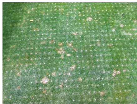
(Fussarium de invierno en greens.)

Para el control del fussarium de invierno se ha realizado un primer tratamiento curativo y preventivo, ya que las manchas en los greens provocan la pérdida de planta en su interior y se produce una pequeña depresión que afecta a la rodadura de la bola.