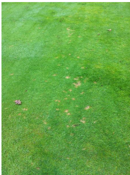
(Dollar spot en calles.)

Si ha estas temperaturas le añadimos una humedad alta proporcionada por las borrascas provenientes del cantábrico, las condiciones son ideales para el florecimiento de enfermedades fúngicas (hongos) en los céspedes. En septiembre se han podido localizar al mismo tiempo, brotes de enfermedades típicas del verano como Dollar spot ( Rustroemia floccosum ) en las calles y manchas en los greens del famoso Fussarium de invierno ( Macrodochrum nivale ).